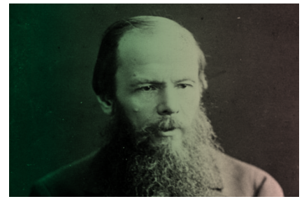
OM FJODOR M. DOSTOJEVSKIJ (1821-1881)